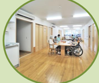
▲食堂 兼 機能訓練室